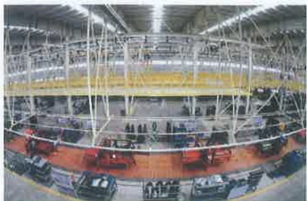
北汽集团华北(黄骅)汽车产业基地汽车生产线

度地减少政府运用行政手段对微观经济活动的直接干预；另一方面，将市场不能发挥作用的领域作为政府的补位边界。对保留的行政审批事项要规范管理、提高效率。全面实施“负面清单”管理模式，保障公平竞争，加强市场监管，维护市场秩序，弥补市场失灵。